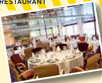
有料レストラン CASANOVA 特別なファンク上のレストランで、 ゆっくりお楽しみください。