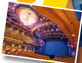
シアター 1,300名収容のシアターでは、 様々なエンターテイメントショーを 鑑賞出来ます。