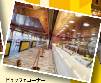
ビュッフェコーナー お好きな時間に自由に 気軽にお食事が出来ます。